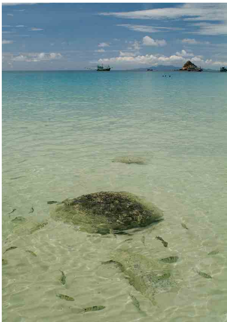
Les eaux cristallines d'Ao Leuk laissent voir des poissons très voraces habitués à être nourris par les touristes de passage.

line qui permet de voir la faune sous-marine sans plonger ! En un mot : un petit paradis oublié. Sauf le week-end !