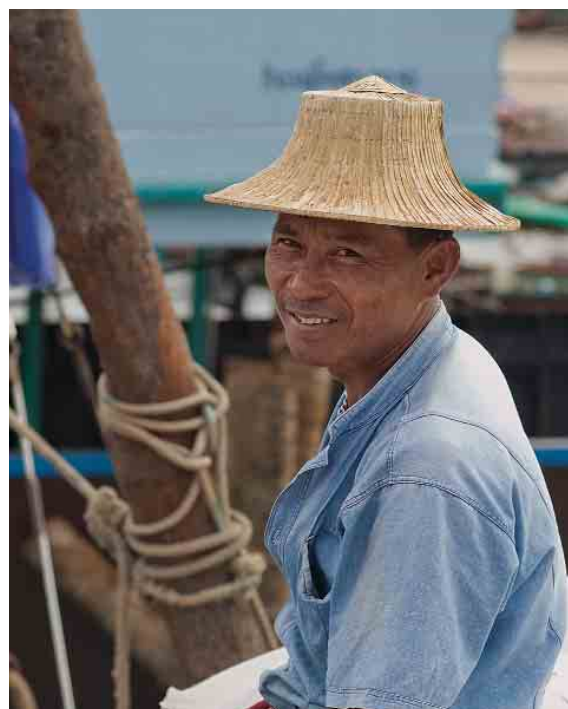
Sur le port de Ban Mae Hat, un docker heureux de sa condition.

Un reportage (texte et photos) d' Hector Christiaen