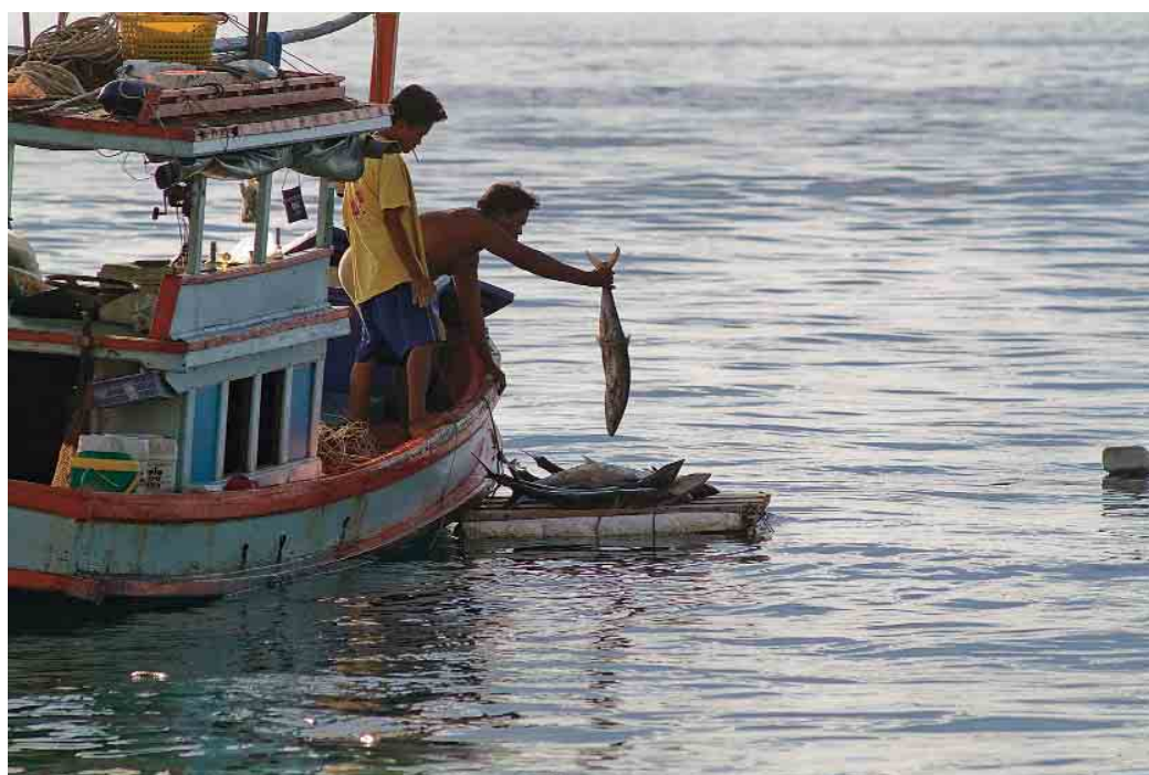
Pour ces pêcheurs d'Hat Sairee, quelques belles prises nocturnes débarquées par un ingénieux système de va-et-vient en radeau.