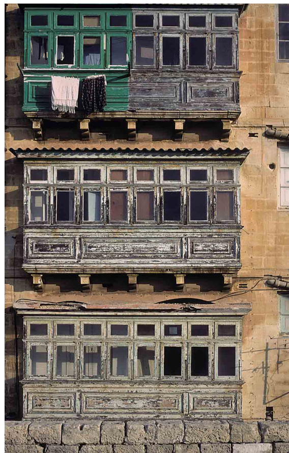
Disciple de Michel-Ange, Francesco Laparelli donna à La Valette son urbanisme quadrillé et ses belles maisons aux balcons fermés qui protègent l'intimité.

La confrérie des Frères Hospitaliers de Saint-Jean de Jérusa-