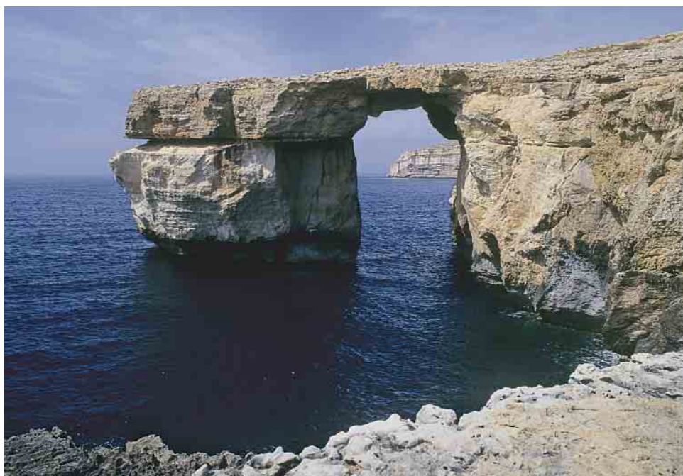
A Gozo, non loin de Dwejra Bay, la fenêtre d'azur se trempe dans une mer d'un bleu minéral intense.

lem, fondée en 1050 pour aider les pèlerins venus sur les lieux de la vie du Christ, s'était constituée en ordre militaire lors des croisades pour combattre l'islam. Chassés de Jérusalem, les frères se replient alors à Saint-Jean-d'Acre puis à Chypre et enfin à Rhodes.