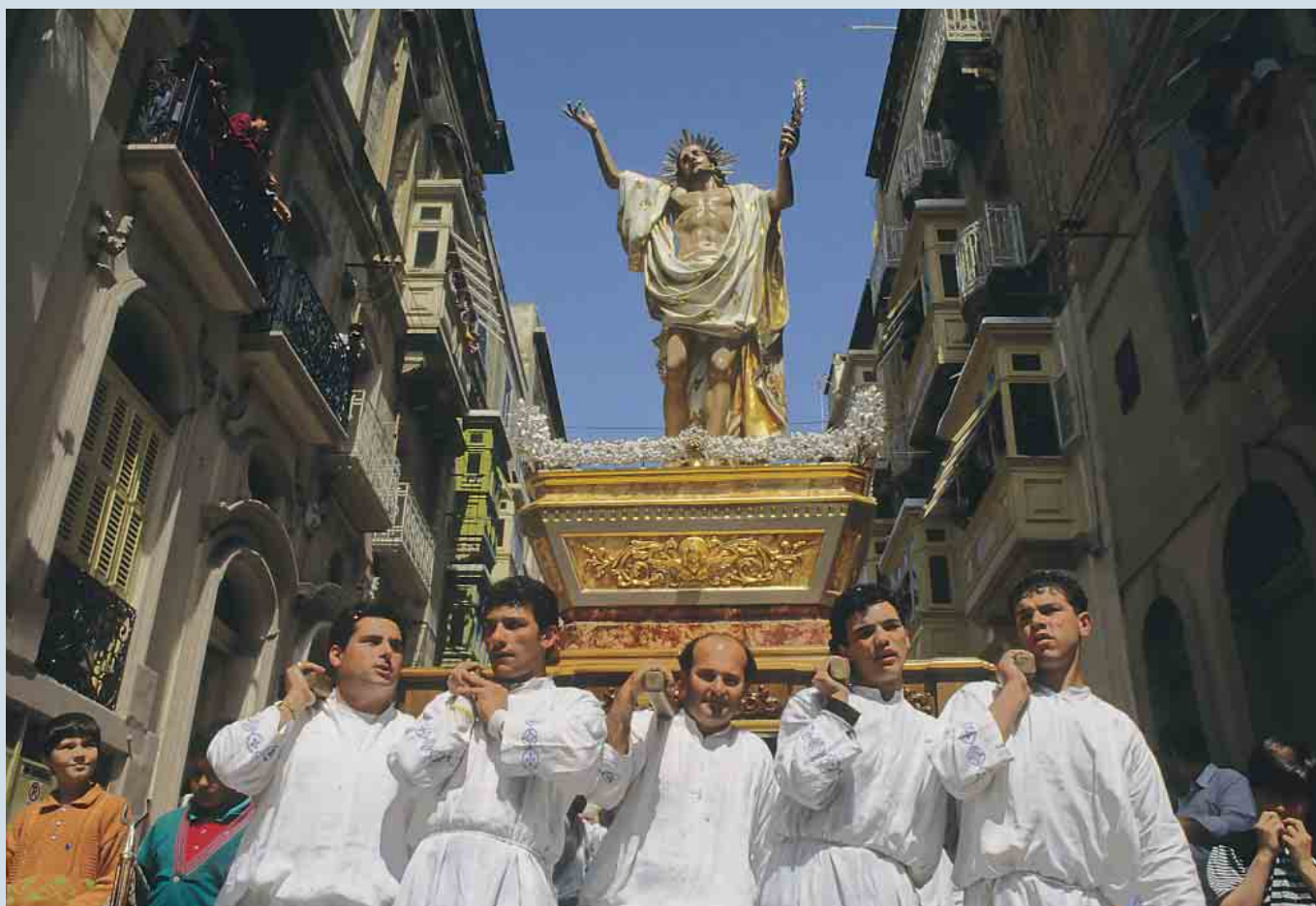
Christ ressuscité promené à travers les rues de Vittoriosa.

n'avons changé ni le cérémonial ni les statues. Cette célébration fait partie intégrante de l'histoire et de la mentalité maltaise». Puis après un temps d'arrêt: «Savez-vous que vos pieds foulent un dallage miraculeux? Lors de la Seconde Guerre mondiale une bombe traversa le dôme et rebondit sur le sol sans exploser!» Dehors, devant les statues, les pénitents s'attachent des paquets de chaînes aux chevilles. A la tombée du jour, ils prennent la tête du cortège afin de parcourir, pieds nus, les rues de la ville. Sur leur passage, la foule, toutes générations confondues, est grave et respectueuse.